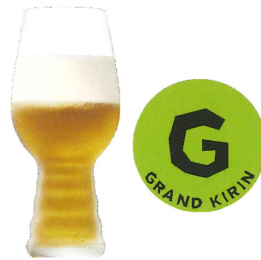
タップマルシェ グランドキリン IPA

この他にも多彩で豊富なビールがございます。ぜひQRコードから特設サイトにてご確認ください！