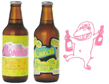
ニッコウモンキーズ ラガー瓶 ニッコウモンキーズ ペールエール 瓶